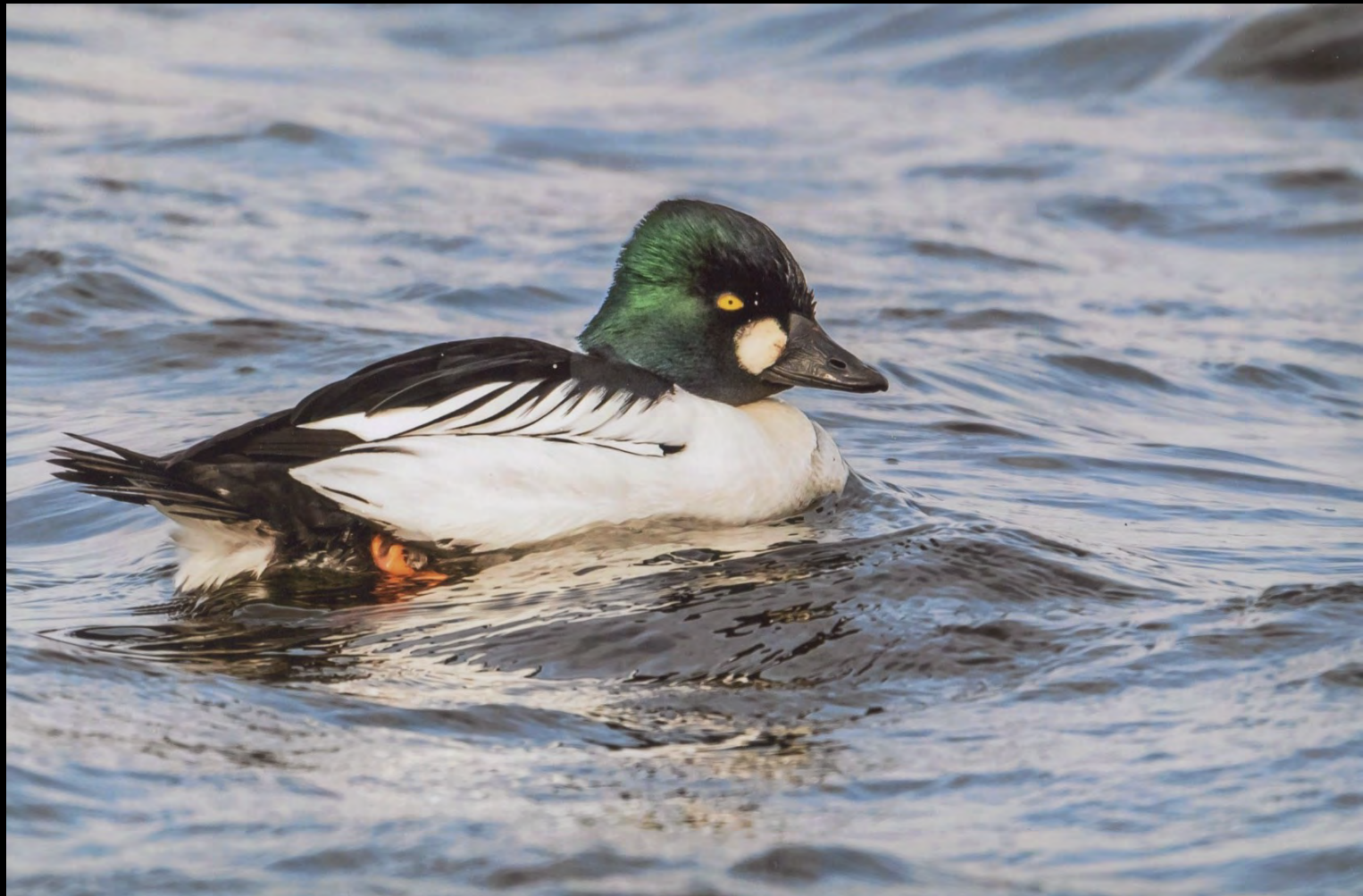
Knipa 91 Mats Kälvemärk